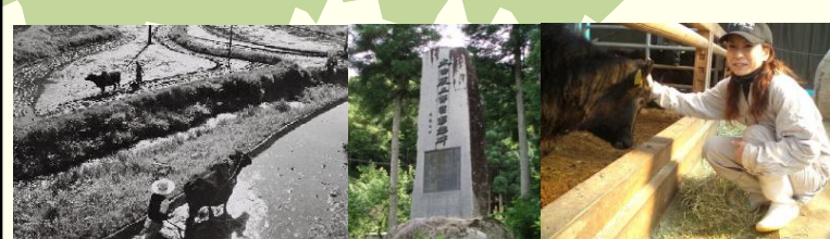
現代と過去をつなぐ太田辰五郎の記念碑