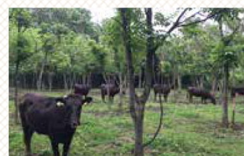
牛が下草を食べると自然と草刈りができ、糞が土地を肥やせば木も育ちます。まさに自然の循環!

うるし コロナ禍で大騒ぎの中、普段と変わらず元気に夏を迎えたいろり牧場の牛達。賑やかな牛舎の脇に目をやると、樹木が育つ林のような一角が。実はこれ、以前から保存されていた漆の畑。荒れていた漆畑も放牧することで整備され、本来の目的である漆掻き(樹液採取)の作業ができるようになりました。漆の保存と牧場の共生を目指しています。