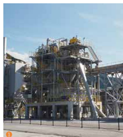
①②チップを燃焼させるボイラー棟と集塵機。1日約90トンの木質チップを使用 ③発電機とタービンは、横の制御室で管理。24時間稼働している