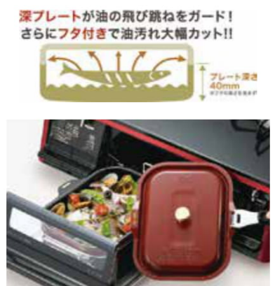
深プレートが油の飛び跳ねをガード! さらにフタ付きで油汚れ大幅カット!!