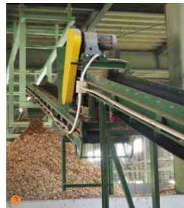
①②大量に備蓄している発電用の木質チップ。針葉樹や広葉樹をチップ状に加工したもの ③大型機械で高品質のチップを製造