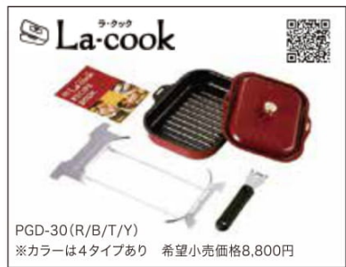
PGD-30(R/B/T/Y) ※カラーは4タイプあり 希望小売価格8,800円

の照り焼きや、粕漬も手軽に調理ができ、使った後のお手入れも楽に。価格や在庫、お使いのコンロが「ラ・クック」に対応した機種かどうか等のご確認は、下記の問い合わせ先までお気軽にご相談ください。