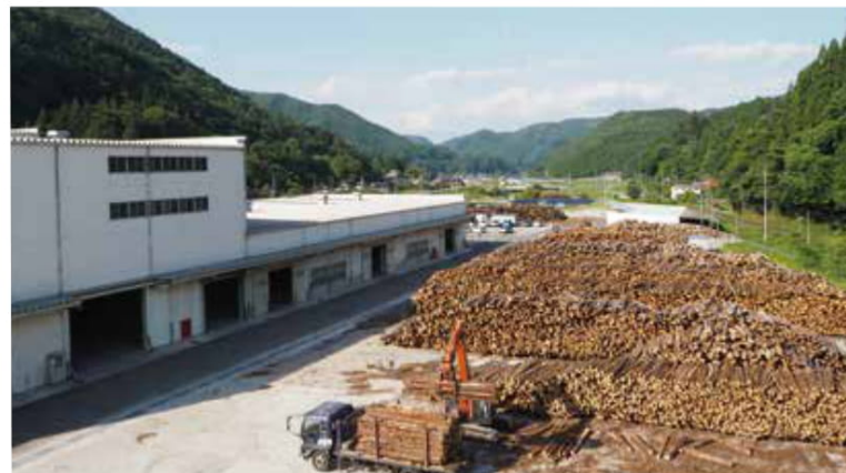
数ヶ月分の原木を保管し乾燥させる貯木場。敷地内は重機が行き交い、木の良い香りが漂う

【取材協力】 ----- 合同会社 新見バイオマスエナジー (TEL.0867-92-9010) 合同会社 新見バイオマスサプライ (TEL.0867-92-6888) 新見市神郷下神代508-1