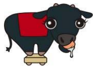
▲ 千屋牛の「チーモくん」