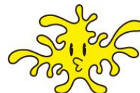
▲ アテツマンサクの「マンサクくん」