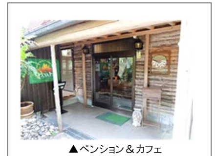
▲ ペンション&カフェ

「地域の人たちに温かく迎えてもらい、たくさんの人に支援をしてもらっていることが、何よりも嬉しいです。将来、私たちが作った野菜をペンションで提供できるよう、がんばります。」と、新しい暮らしを満喫されています。