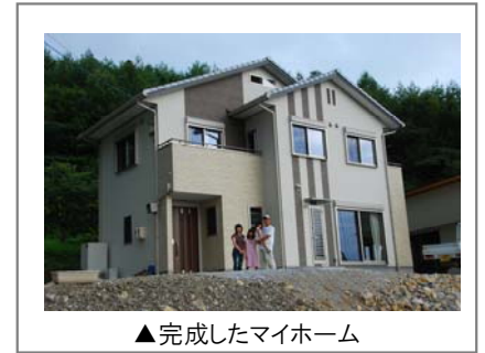
▲ 完成したマイホーム

念願のマイホームも完成し、ひとつひとつ着実に夢を実現させています。「新しいことにチャレンジして、魅力をもっとアピールして、若い人がもっと飛び込んでくるような地域をつくりたい。」と熱い想いを語ってくれました。